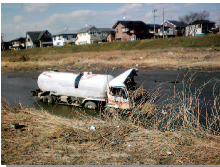
1.15 仙台市内 河川まで流出したLPGタンクローリ