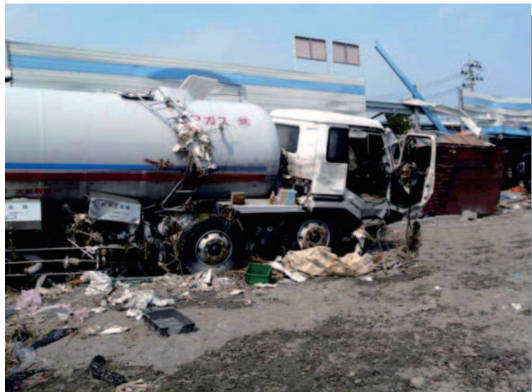
1.11 仙台港付近 流されたLPGタンクローリ