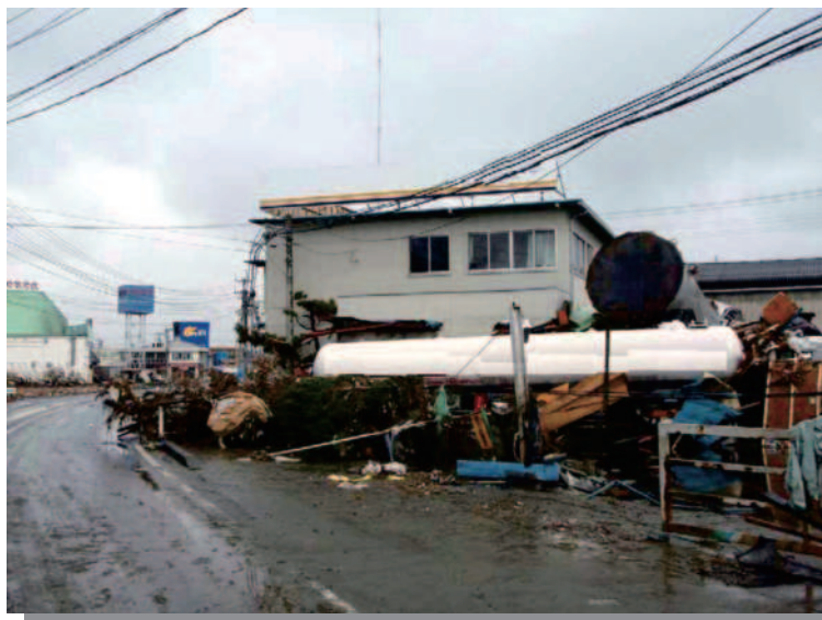
1.14 仙台港付近 流されたLPGタンクローリ