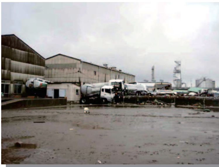
1.13 仙台港付近 流されたタンクローリ