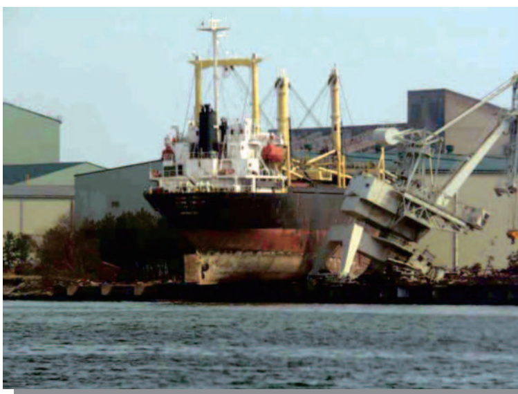
1.18 仙台港 大型貨物船（5,472 t）が陸上に乗揚げ、 ガントリークレーンを破壊した。 9月より解体作業を開始