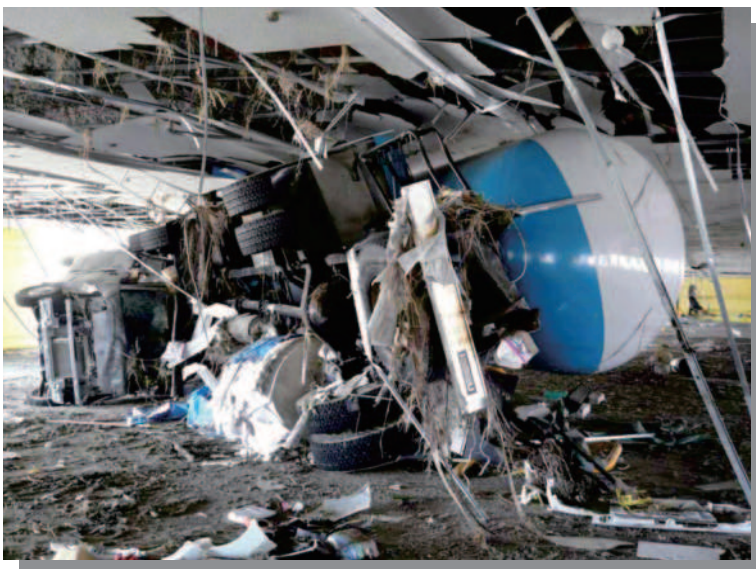
1.6 仙台港付近 量販店の駐車場まで流されたLPGタンク ローリ