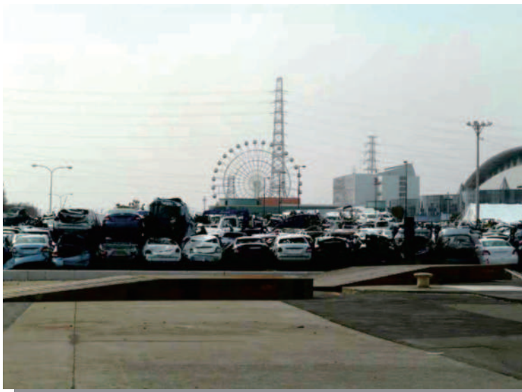
1.16 仙台港付近 近流失した車輛の集積場