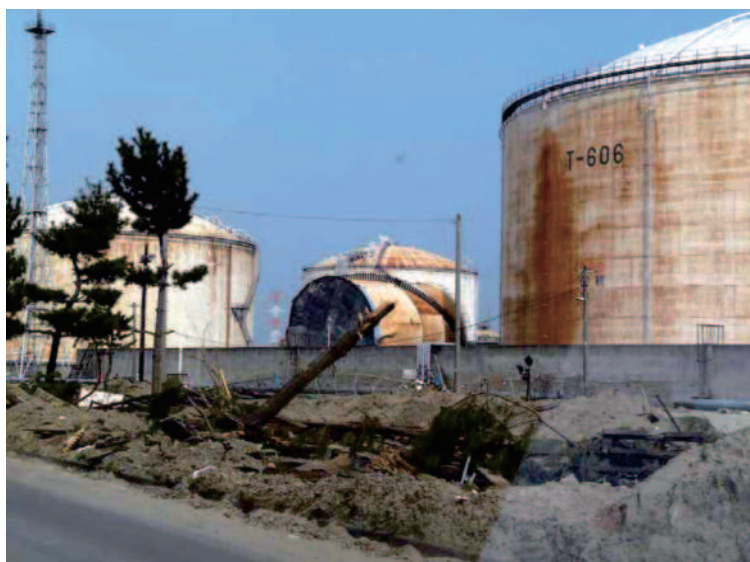
1.20 仙台港 輸入基地内で被災し転倒した 有水式ガスホルダー