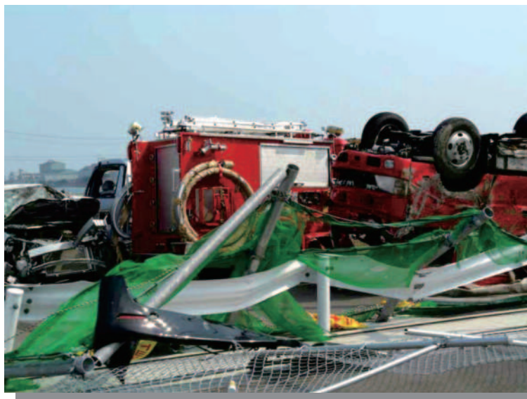
1.17 仙台港付近 流出し転倒した消防車輛