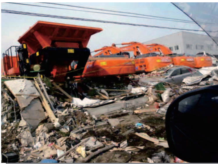
1.19 仙台港付近 被災した重機