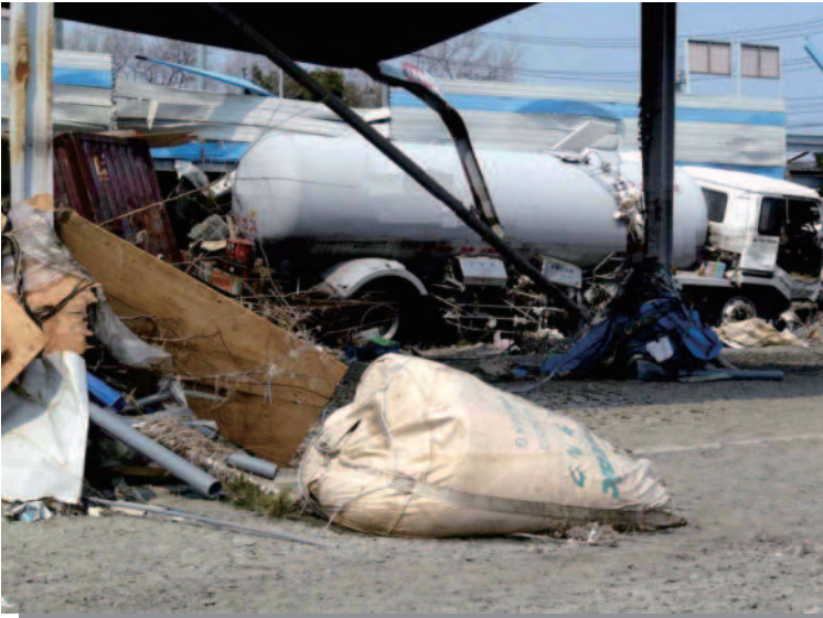
1.10 仙台港付近 流されたLPGタンクローリ