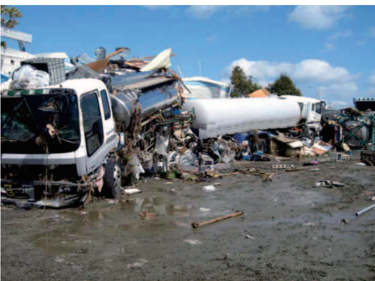
1.12 仙台港付近 流されたタンクローリ