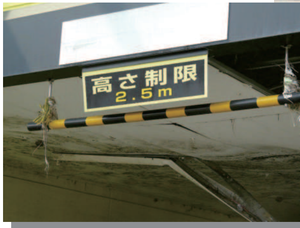
1.5 仙台港付近 量販店の駐車場まで流されたLPGタンクローリ (駐車場の車輛高さ制限表示)