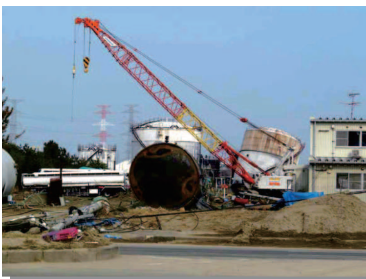
1.21 仙台港 転倒した石油タンク