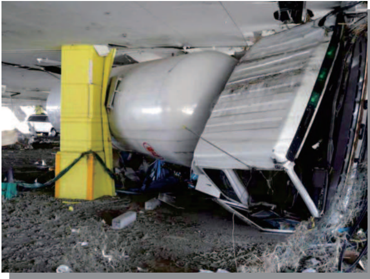
1.4 仙台港付近 量販店の駐車場まで流された LPGタンクローリ